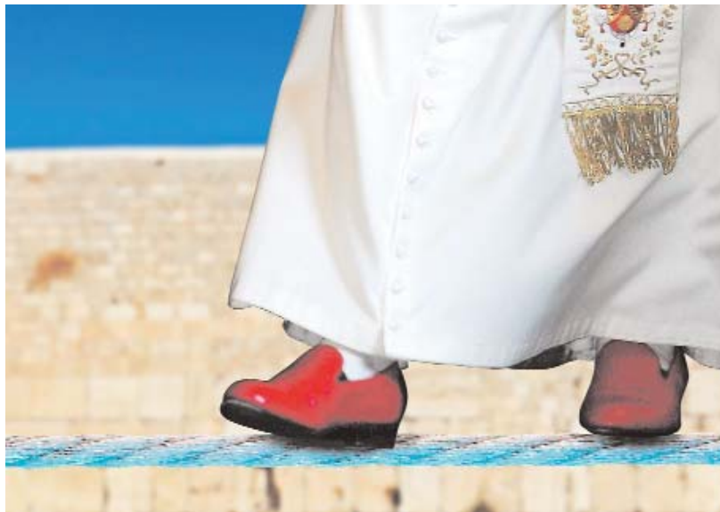
Auf dem Drahtseil: Benedikt XVI. wird in Israel nicht nur beten und Messen lesen, sondern womöglich auch polarisieren.

Nahostkonflikt, Pius-Brüder und Schoa: Warum die Israelreise des Papstes keine einfache Pilgerfahrt wird